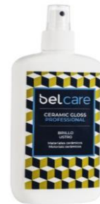
INCLUIDO EN EL KIT