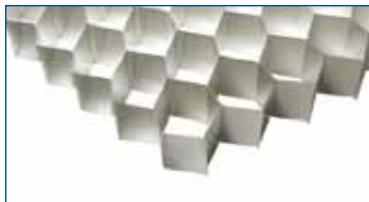
Nido de abeja de aluminio